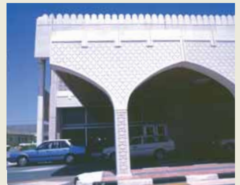
Selbst für Filigranes wie orientalische Verzierungen findet Reckli die passende Form.