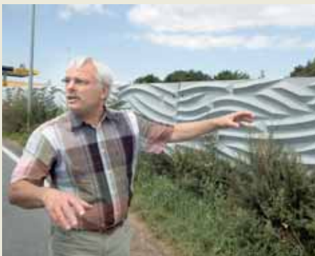
Die Muster in der Schallschutzwand an der A2 bei Gelsenkirchen stammen von Reckli.