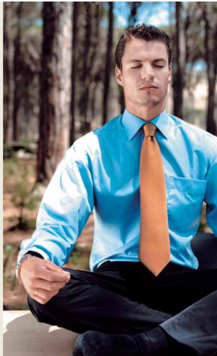
6 Meditation – kann, muss aber nicht: Es gibt viele Wege zur Entspannung. Mindestens einen aber sollte jeder gehen, der beruflich viel um die Ohren hat.

Berdis Business: Kein Erfolg unter dieser Nummer • Netzgesellschaft nmr ist gestartet • Erfinderische Energie: Das Faxgerät • Störungen: Stadtwerke Herne weit besser als der Bundesdurchschnitt • Stadtwerke Herne mit „Wasserzeichen“ ausgezeichnet • Impressum