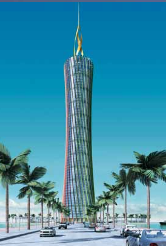
Der Burj Al-Taqa in der Simulation: 322 Meter, 68 Stockwerke – und kein Funken Primärenergieverbrauch.

Ein Windrad in Flammenform, eine rotierende Solar-Fassade: Am Golf entsteht das erste Hochhaus der Welt, das sich vollständig selbst mit Energie versorgt – die Pläne dafür kommen aus dem Ruhrgebiet.