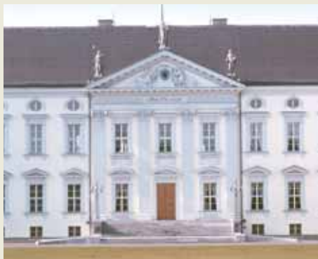
Dem Berliner Schloss Bellevue verhalfen die Herner zu dauerhaftem Stuck aus Beton.