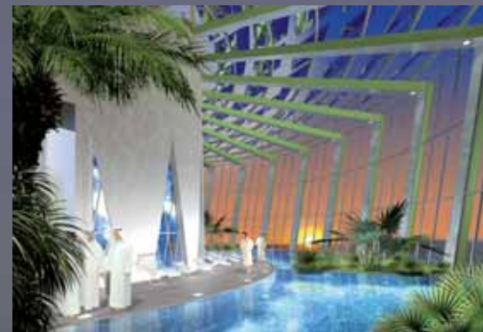
Die hängenden Gärten auf den Etagen werden über ein ausgeklügeltes System mit Frischluft versorgt.

Über ein Atrium, das sich vom Sockel bis zur Spitze durch den Tower zieht, sowie hängende Gärten auf den Etagen soll sich die Frischluft im Innern verteilen. Zuvor wird sie durch Kanäle im Boden und im Meer geleitet und so vorgekühlt, weiter heruntergekühlt wird sie elektrisch. Den dazu nötigen Strom sollen Solarzellen und ein Windrotor auf dem Dach liefern.