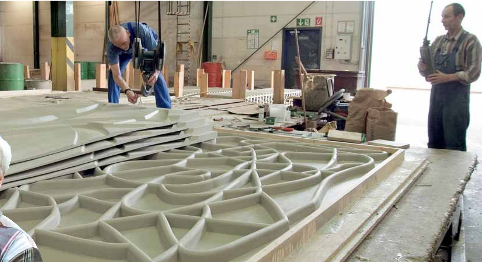
Die Reckli-Mannschaft kann nahezu jedes beliebige Muster nachahmen. Der Schlüssel zur Schönheit in Beton sind elastische Matrizen. Weil die Nachfrage groß ist, erweitert das Unternehmen gerade wieder (Bild unten).